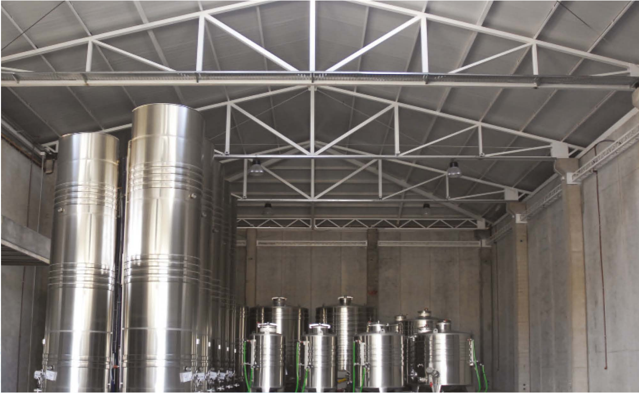
Cumple con la norma: NOM-008-ZOO-1994.